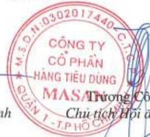
Trương Công Thắng Chủ tịch Hội đồng Quản trị