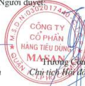
Trương Công Thắng Chủ tịch Hội đồng Quản trị

Các thuyết minh đính kèm là bộ phận hợp thành của báo cáo tài chính riêng giữa niên độ này